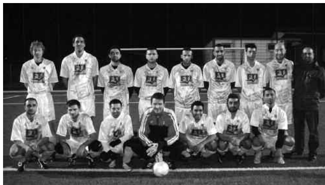
Ceppi Cup-Sieger: Nordwestschweiz

Die Nordwestschweizer Schiedsrichterauswahl hat das Spiel gegen die Innerschweizer Unparteiischen mit 5:1 gewonnen und behält den Ceppi Cup in seinen Reihen. Auf dem schönen, neuen Kunstrasenfeld des FC Bubendorf tasteten sich die beiden Teams gegenseitig ab. Die Basler besaßen mehr Spielanteile, Chancen waren aber in der ersten Viertelstunde noch keine vorhanden, bevor dann doch noch das 1:0 geschossen wurde. Danach erhoffte man sich, dass es mit der Führung offensiv vielleicht etwas einfacher wurde, doch auch die Innerschweizer kamen mit Kontern immer wieder mal gefährlich vors Tor und erzielten dann auch nicht unverdient den zwischenzeitlichen Ausgleich. Kurz vor der Pause ging die NWS aber wieder in Führung, womit der psychologische Vorteil klar auf Seiten der Gastgeber war.