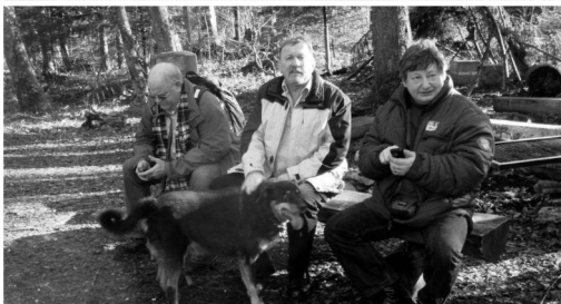
weitere Bilder unter www.ssv-nws.ch