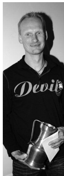
weitere Bilder unter www.ssv-nws.ch